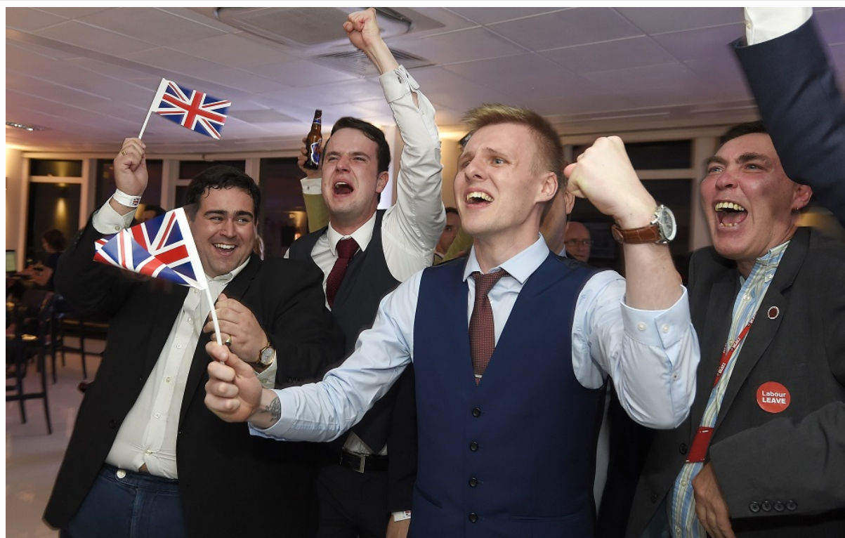
Reino Unido votó "sí" al brexit