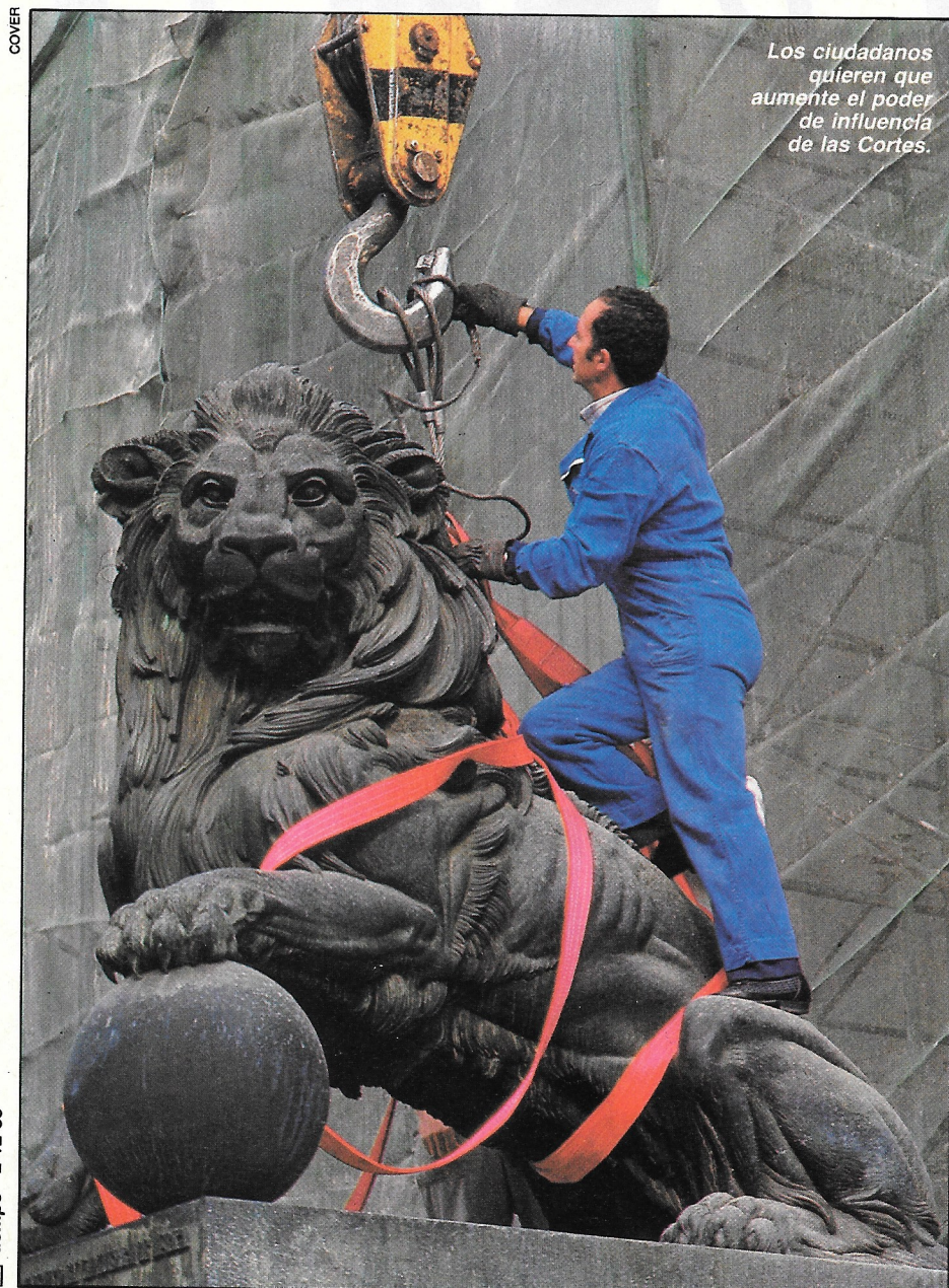
Los ciudadanos quieren que aumente el poder de influencia de las Cortes.

AP, PRD y CDS coinciden en desear más poder para las Cortes (aunque los de AP y CDS desean en segundo lugar al poder judicial y en tercer lugar al Gobierno, mientras que los del PRD prefieren al Gobierno y luego al poder judicial), los votantes del PSOE desearían que el Gobierno fuese la institución con más poder, seguido de las Cortes y del poder judicial en tercer lugar. Por su parte, los votantes del PCE conceden también prioridad a las Cortes sobre el Gobierno, pero incluyen a los sindicatos en tercer lugar, relegando al poder judicial al sexto lugar.