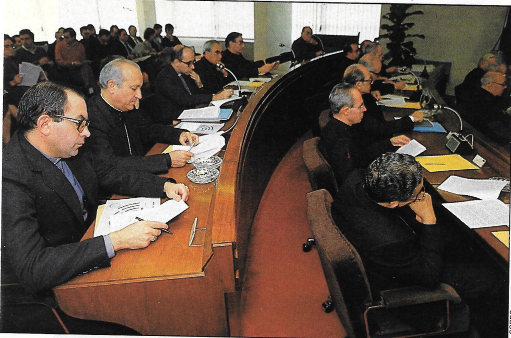
A la Iglesia se la ve con poco poder; pero además se prefiere que no tenga más.

El caso más patético, sin embargo, parece ser el de los partidos políticos, que además de ser la institución menos valorada junto con la Banca (no sólo de entre estas diez, sino de las 43 por las que se preguntó mensualmente en los sondeos OTR/tiempo de septiembre de 1984 a junio de 1985) es también una institución a la que se percibe con poco poder y a la que se desea aún menos poder.