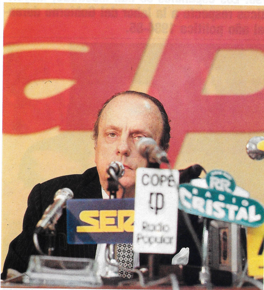
La mayoría cree que el Gobierno espía a los partidos políticos de la oposición.

En otras cuestiones, como la lucha contra el terrorismo, y la política de seguridad ciudadana y la lucha contra la delincuencia , la legalización del aborto , la política educativa , la reconversión industrial, la política autonómica , la recepción oficial dispensada al Presidente Reagan , la modificación de los horarios comerciales, o la lucha contra el fraude en el consumo, la opinión pública está muy dividida entre quienes respaldan claramente el Gobierno y quienes están firmemente en desacuerdo con él. LO DESCONOCIDO. Finalmente, hay bastantes medidas del Gobierno que al parecer son menos conocidas por los españoles, como el AES , la reforma militar , las retribuciones a los funcionarios , los acuerdos pesqueros , las medidas para estimular el consumo , la nue-