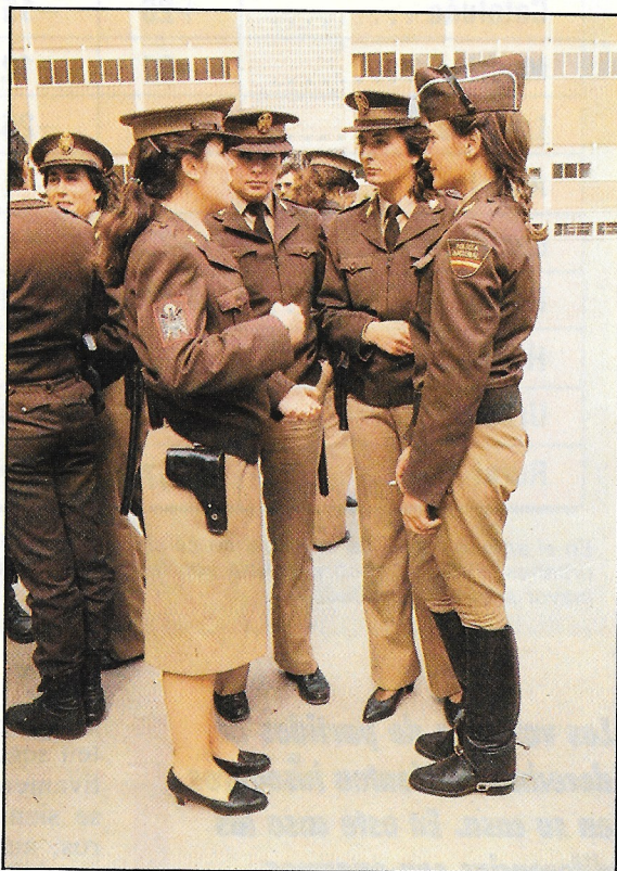
La Policía Nacional está bien valorada por los ciudadanos.

En conclusión, se pone totalmente de manifiesto que los españoles se sienten básicamente faltos de seguridad ciudadana adecuada (salvo, en todo caso, en su propia casa), y ade-