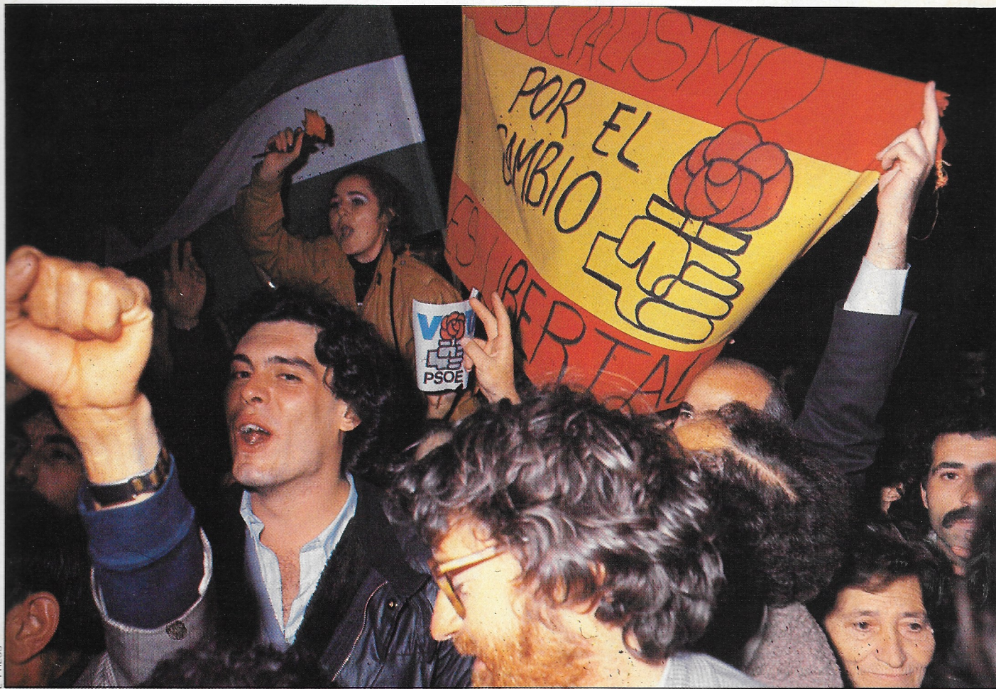
A pesar del desencanto, un 39 por 100 de los jóvenes españoles sigue apoyando al PSOE.