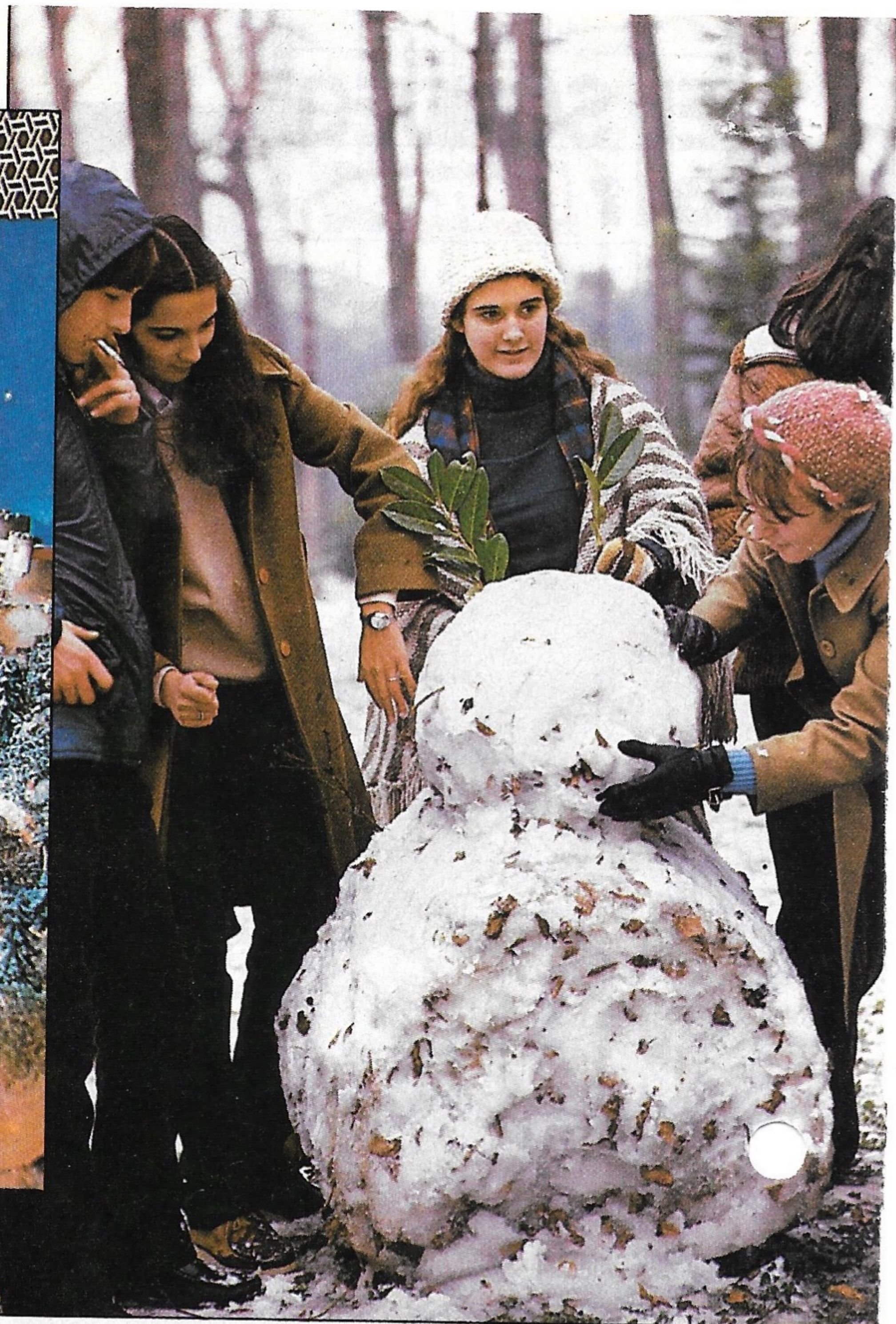
Navidades blancas, para los jóvenes un aliciente más en las vacaciones.

edad (mayores de cincuenta) se pone de relieve al evaluar el sentido tradicional de las Navidades. Así, ante la afirmación de que «son fiestas que tienden a perder su carácter tradicional», el grado de acuerdo disminuye con la edad, mientras que, frente a la afirmación: «El ambiente navideño se ha perdido por la vida moderna», son los de más edad quienes están más de acuerdo. En realidad, ello parece indicar que los de más edad defienden y les preocupa el carácter tradicional de las Navidades, mientras que los jóvenes no sienten la pérdida de esas tradiciones.