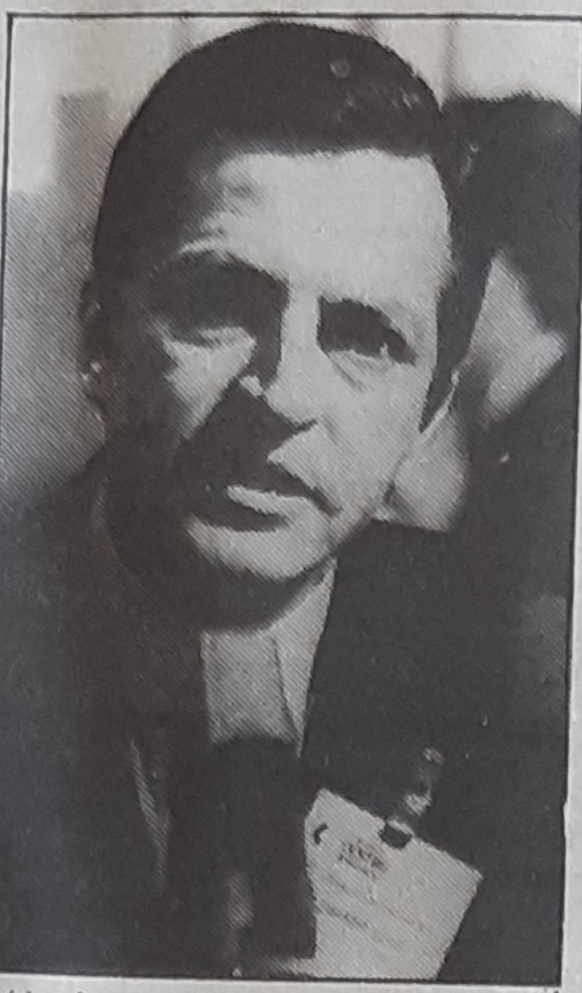
«Se ha retirado con un caudal de prestigio suficiente como para que su vuelta no sea, ni mucho menos, improbable.»